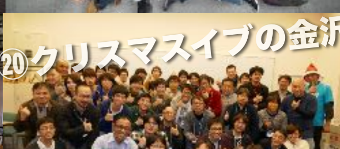
⑳ クリスマスイブの金沢